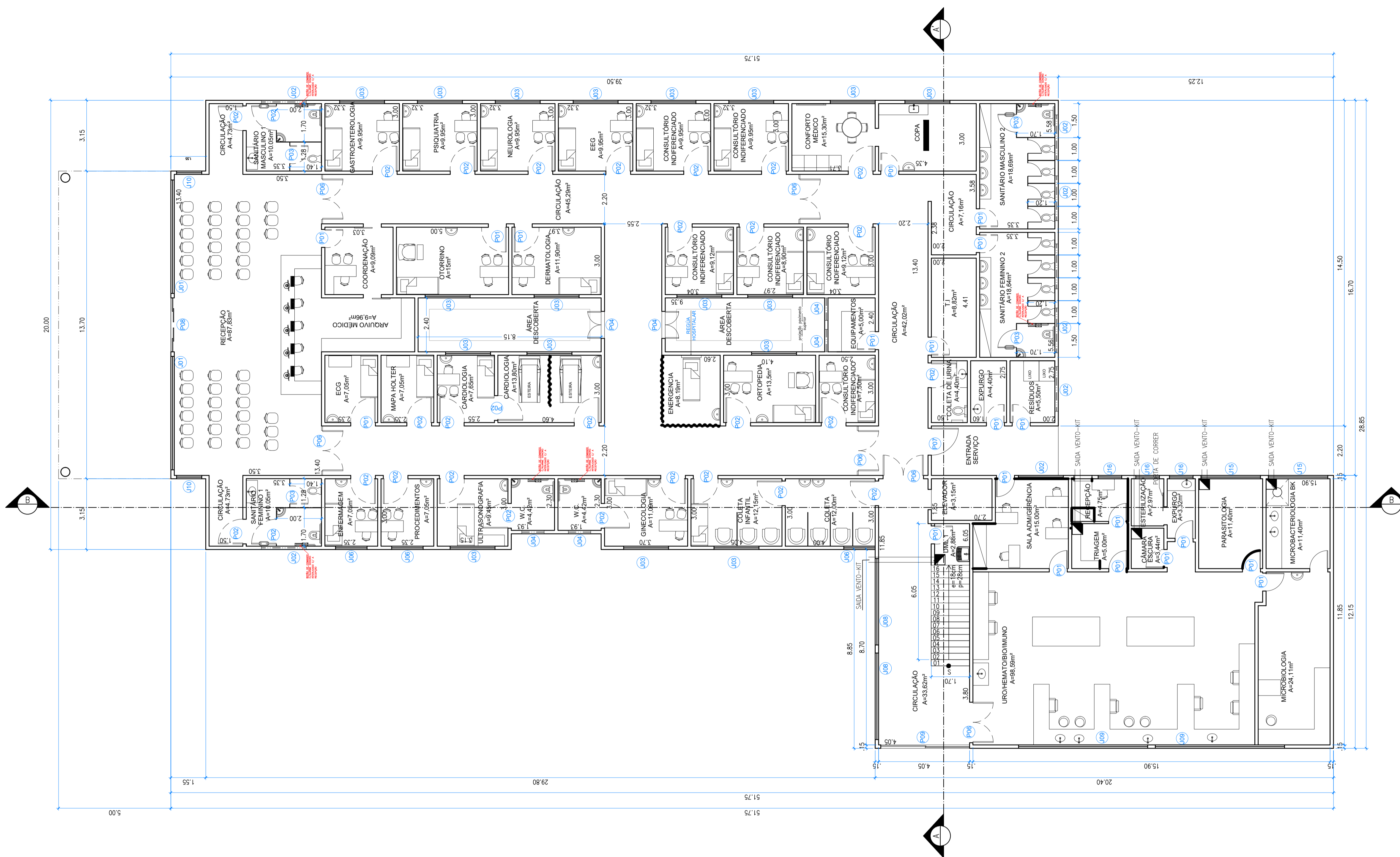
01 PLANTA BAIXA - 1º PAVIMENTO ESCALA : 1/100